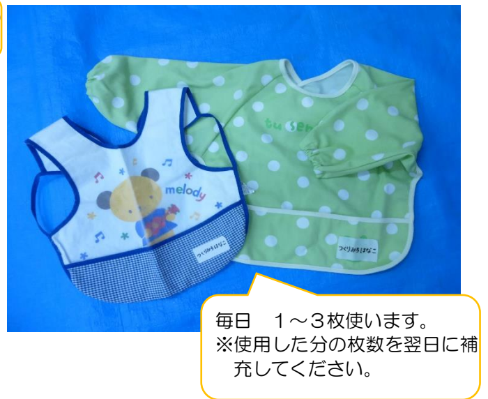
【0. 1. 2歳児 食事用エプロン】