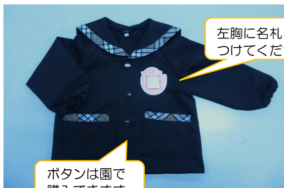
【2, 3, 4, 5 歳児 園服】