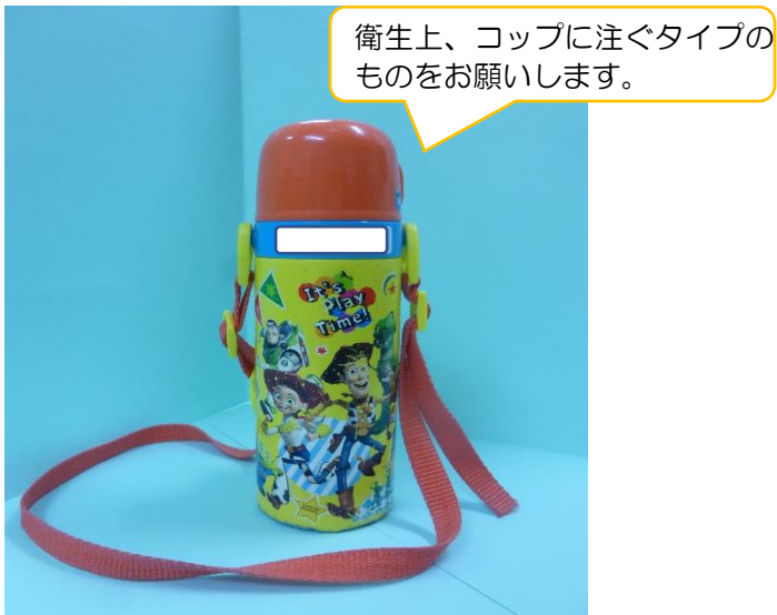
【3. 4. 5歳児 水筒】