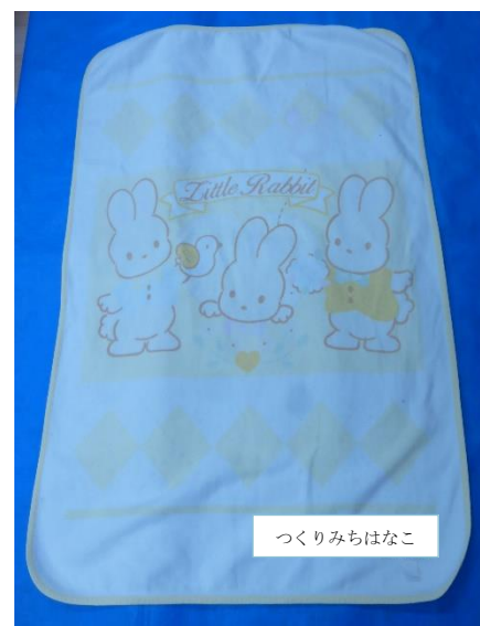
【午睡用具 ベビー毛布】