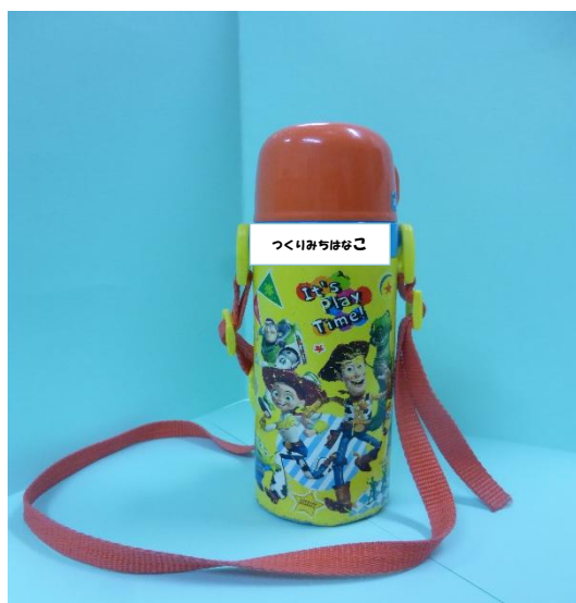
【3. 4. 5歳児 水筒】