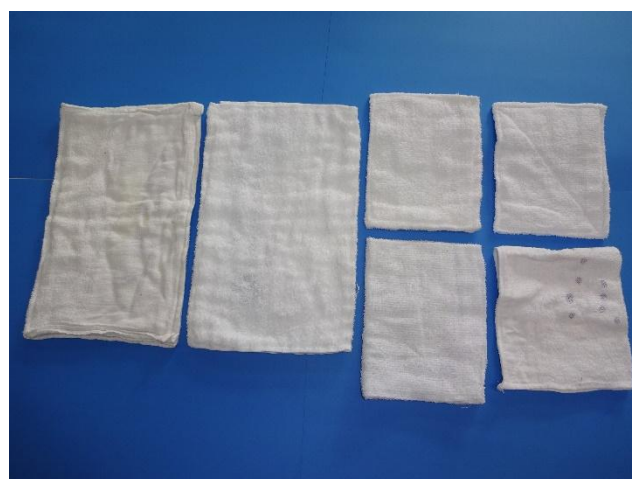
【3. 4. 5歳児雑巾（記名なし）】