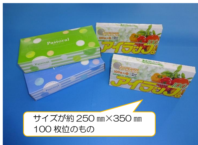
【ティッシュペーパー・ポリ袋（箱入り）】