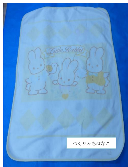
【午睡用具 ベビー毛布】