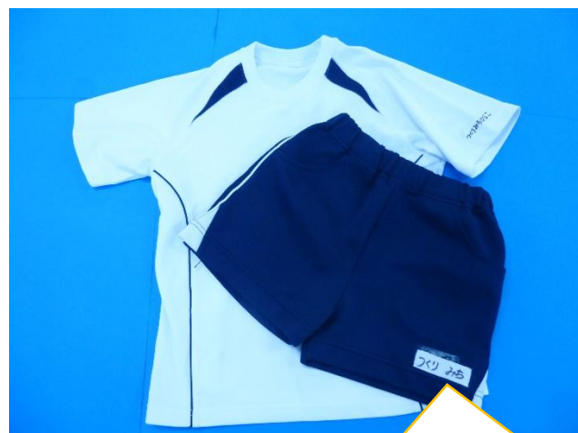
【3. 4. 5歳児 体操服】

名前のタグを上着、ズボンそれぞれに、 縫い目にそってつけてください。 体操服の内側のタグにも記名を お願いします。