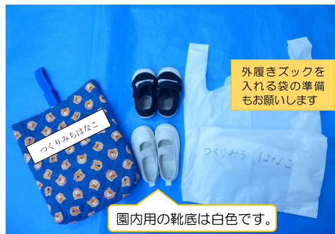
【内履きズック・外履きズック・ズック袋】