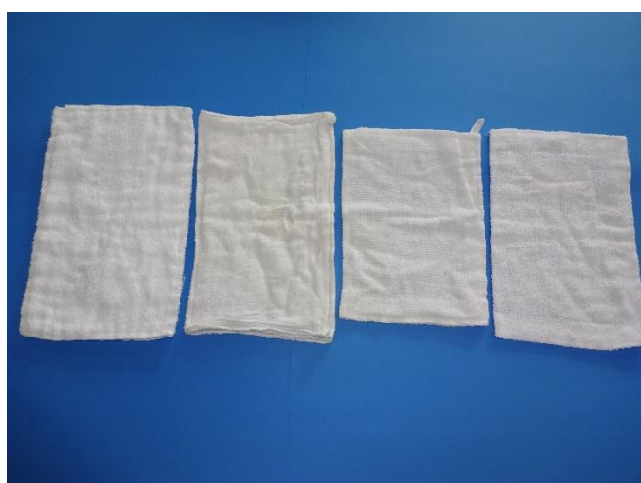
【0. 1. 2歳児雑巾（記名なし）】