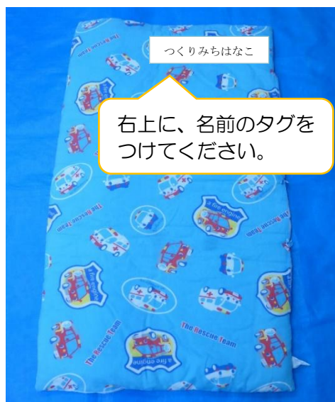
【午睡用具 敷布団・表】